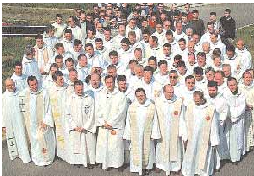
Els sacerdots, feliços de viure la seva missió amb els laics.

lloança, que marca el seu ser i el seu ministeri, és una actitud d'admiració i una mirada d'esperança sobre l'obra de Déu en el món i en l'Església. És un adorador del Pare. Passa llargues estones al davant del Santíssim Sagrament, en la presència de Jesús en l'Eucaristia per demanar un cor semblant al seu: "Jo us donaré pastors segons el meu cor..." La seva vocació, la seva vida i la seva predicació, estan relacionades amb l'espiritualitat del Cor de Jesús. Aquest cor